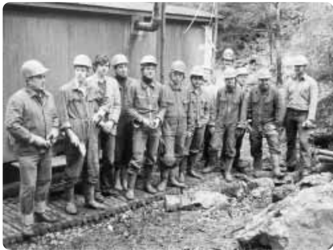
Ein Bild aus der Anfangszeit 1978 vor dem „Christiansgang“ im Schnaizteich, wo die Bemühungen, ein Besucherbergwerk zu schaffen, nach fast zwei Jahren gescheitert sind.