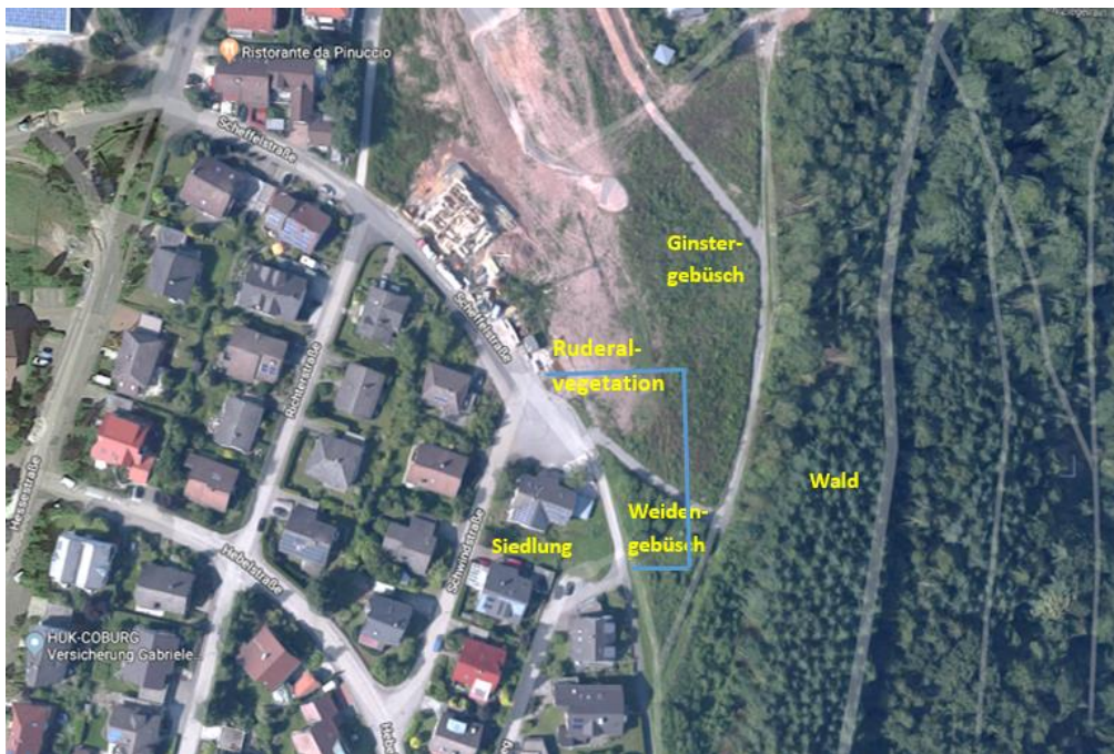
Abb. 3: Ausstattung des Untersuchungsgebietes; die blaue Linie gibt die ungefähre Grundstücksfläche an (Kartengrundlage: Google-maps)