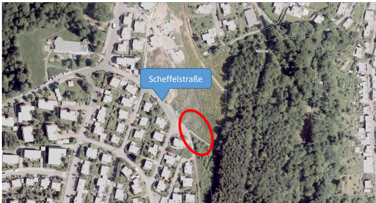
Abb. 1: Vorhabengebiet an der Scheffelstraße in Neuenbürg

Das Vorhabengebiet liegt auf der Ostseite des südlichen Endes (Wendehammer) der Scheffelstraße. Westlich erstreckt sich ein Wohngebiet, nördlich werden aktuell Gebäude errichtet. Nach Osten und Süden liegt die freie Landschaft. Das Gelände fällt steil nach unten über einen bewaldeten Hang zu den tiefer gelegenen Ortsteilen von Neuenbürg ab.