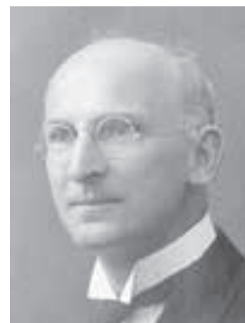
Dr. Ing. Walter Hohmann

Was den promovierten Ingenieur zeitlebens umtrieb, war weniger die Baustatik als vielmehr das Weltall und seine weit entfernten Galaxien. Mit seinen Berechnungen der Flugbahnen zum Mond und zu den Nachbarplaneten – nach ihm auch Hohmann-Bahnen benannt – ging er in die Geschichte der Weltraumfahrt ein. Davon zeugen auch ein Mondkrater und ein 2005 entdeckter kleiner Planet, die seinen Namen tragen. Der Eintritt ist frei. Der Vortrag findet im Rahmen der Sonderausstellung „Phänomen Universum. Utopie und Wirklichkeit“ in der Kutscherstube statt.